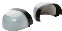
Puntera no metálica