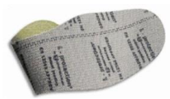
Plantilla anti-perforación flexible