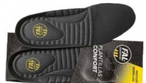
Plantillas extraíbles. Lavables