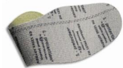
Plantilla anti-perforación flexible