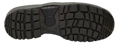
Suela Antiestática + Resistente a los hidrocarburos