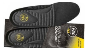
Plantillas extraíbles. Lavables