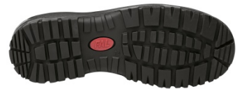
Suela antiestática, resistente a los hidrocarburos y al calor