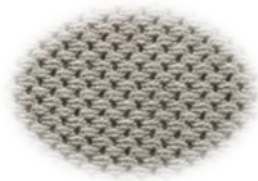
Forro de cuello transpirable