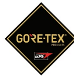
Membrana del forro impermeable + transpirable