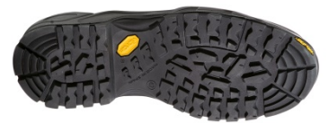
Suela de caucho Vibram