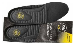
Plantillas extraíbles. Lavable