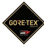
Membrana del forro impermeable + transpirable