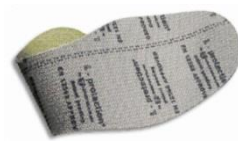
Plantilla anti-perforación flexible