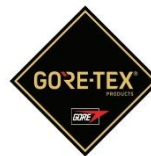
Membrana del forro impermeable + transpirable