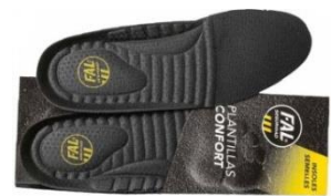
Plantillas extraíbles. Lavable