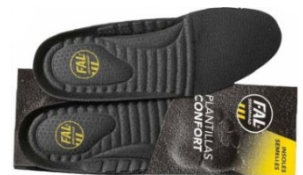
Plantillas extraíbles lavables