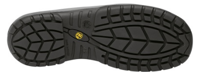
Suela Antiestática + Resistente a los hidrocarburos