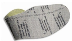
Plantilla de protección flexible