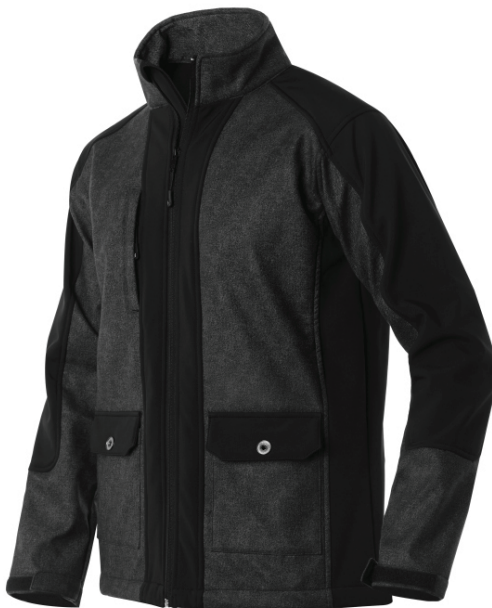
C. 474 Gris/Negro