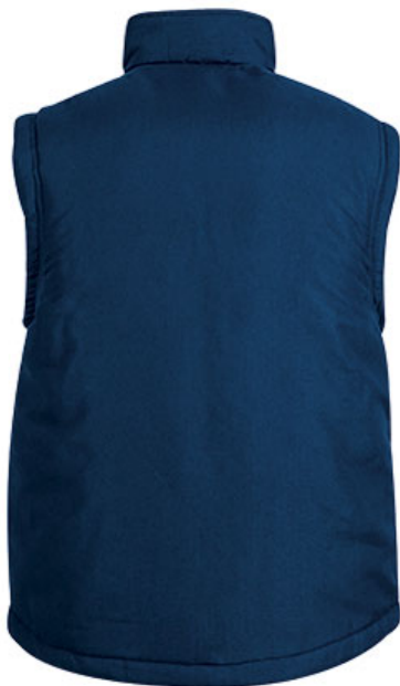
Vista parte trasera de la prenda (espalda)