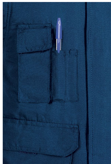
Detalle bolsillo en pecho derecho