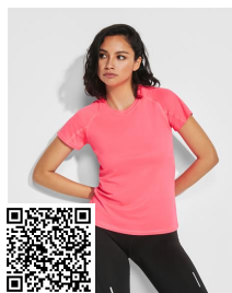
BAHRAIN WOMAN CA0408