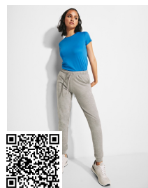
ADELPHO WOMAN PA1175